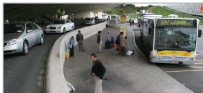
POR CARRETERA. Los usuarios del aeropuerto sólo pueden llegar ahora a la terminal en vehículo, ya sea público o privado.

Uno de los principales inconvenientes del aeropuerto de Loiu radica en sus conexiones. La alternativa es tan sencilla que sólo existe una, la carretera. Vehículo privado, taxi, autobús urbano... El ferrocarril se queda a escasos kilómetros, en Sondika, en la parada de la línea de Euskotren trazada por el valle del Txorierrri. Sin embargo, este panorama va a experimentar un importante cambio durante los próximos años.